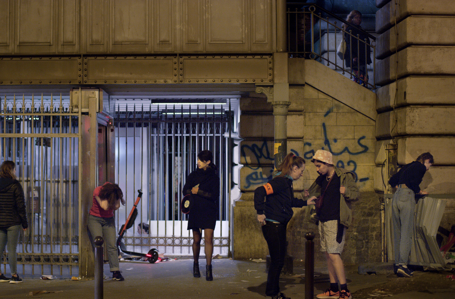
Métro – Barbès de la série Les Intruses , 2019 © Randa Maroufi

Randa Maroufi est née en 1987 à Casablanca, au Maroc. Elle est diplômée de l'Institut National des Beaux-Arts de Tétouan, Maroc (2010), de l'École Supérieure des Beaux-Arts d'Angers, France (2013) ainsi que du Fresnoy – Studio National des Arts Contemporains, Tourcoing, France (2015). Randa Maroufi était membre artiste de l'Académie de France à Madrid – la Casa de Velázquez en 2017 – 2018. Elle vit et travaille à Paris.