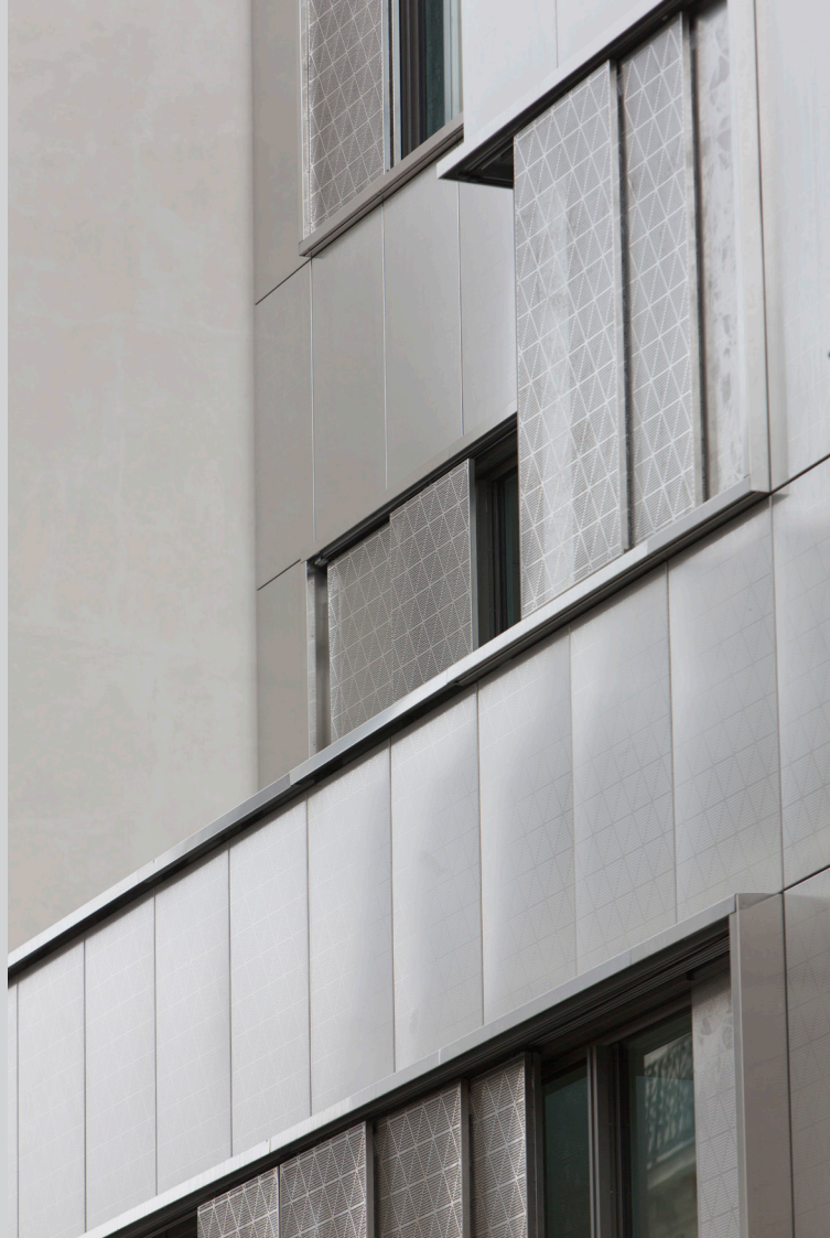
Façade ICI Stephenson