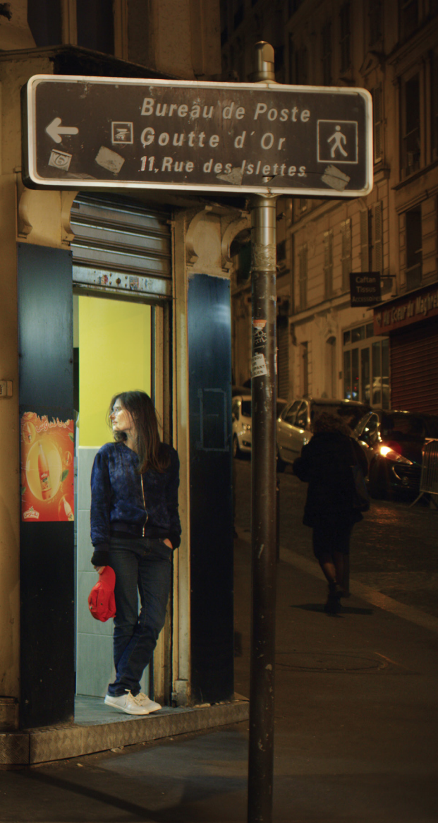
Mhajbi de la série Les Intruses , 2019 © Randa Maroufi