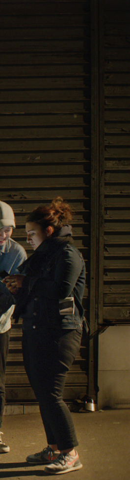
Coiffeur de la série Les Intruses , 2019