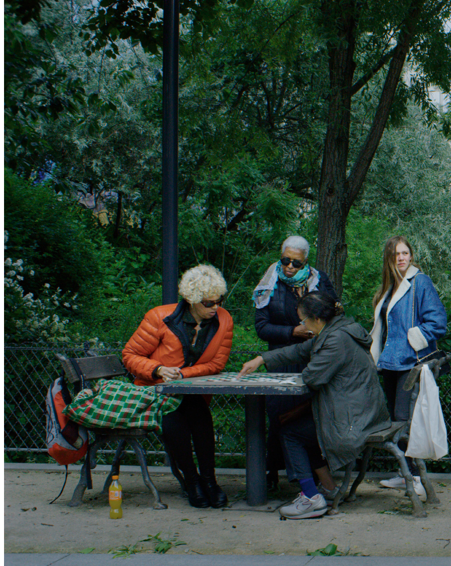
Parc Léon – Barbès de la série Les Intruses , 2019 © Randa Maroufi