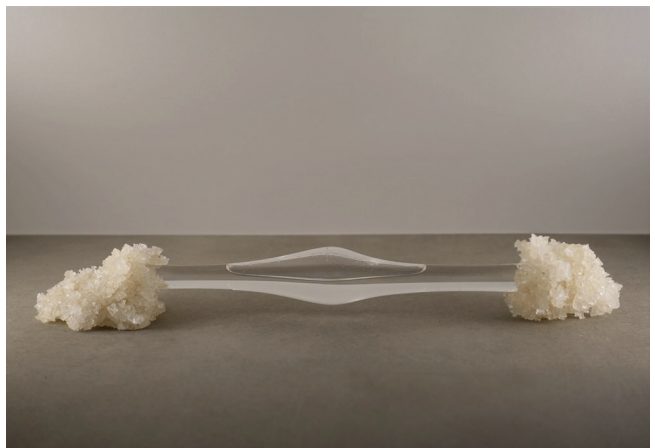
Relique de la Rose de Jéricho - Eau de la mer Morte Sculpture en verre soufflé, eau et sel de la mer Morte, 24 x 5 x 7 cm, 2018 © Aurélia Zahedi, ADAGP, Paris, 2023