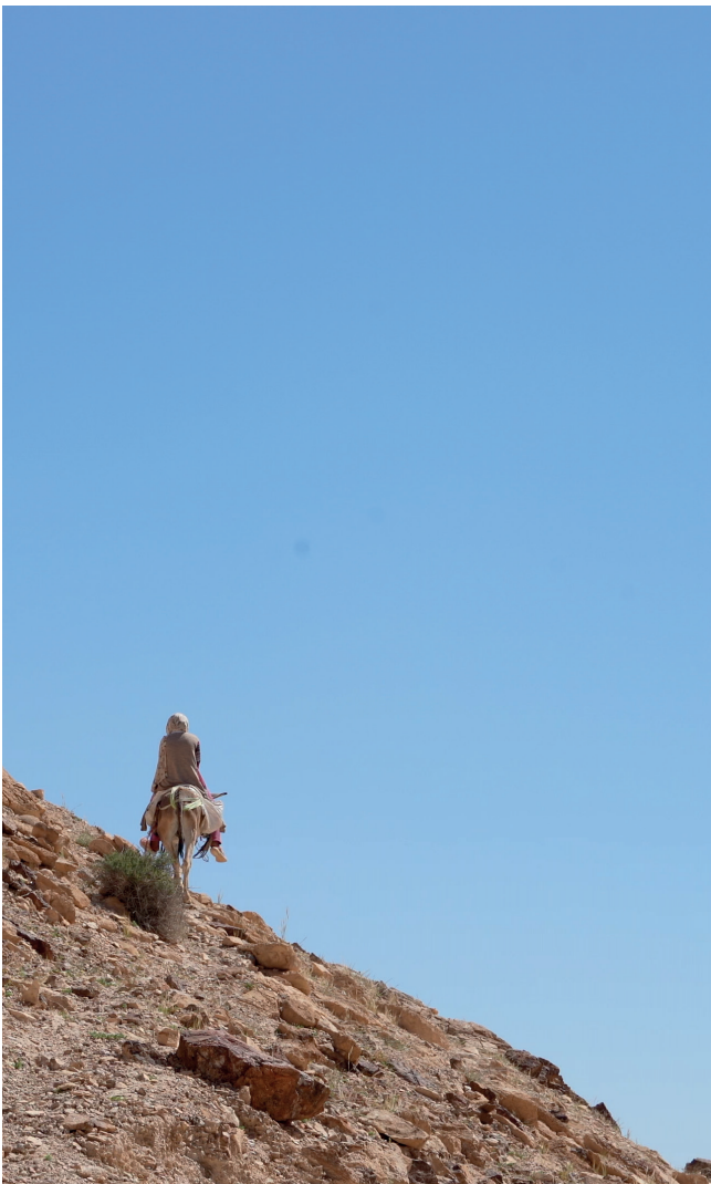
La Rose de Jéricho (extrait film) Vidéo couleur HD avec son, 24"37', 2023 © Aurélia Zahedi, ADAGP, Paris, 2023