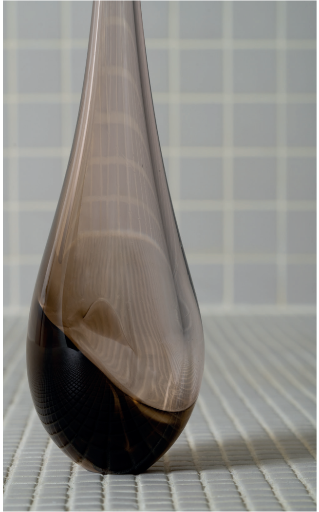
Vase lacrymatoire Sculpture en verre soufflé, 37 x 7 cm, 2023 Crédit photo : Maurine Tric à l'ICI - Institut des Cultures d'Islam © Aurélia Zahedi, ADAGP, Paris, 2023