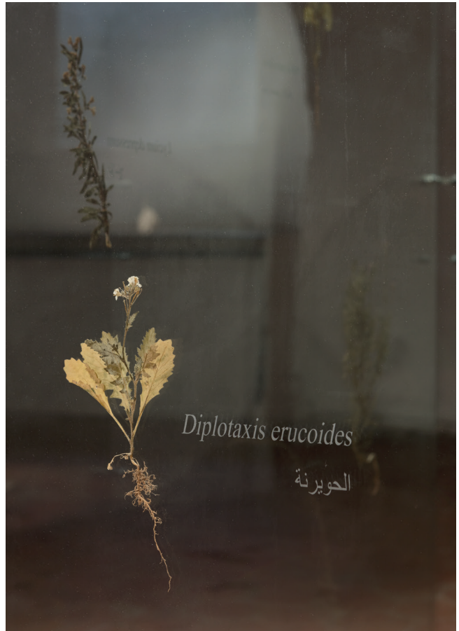
Herbier de l'ancien cimetière musulman de Jéricho, détail Sculpture, verre, végétaux, 200 x 120 x 50 cm, 2019 Crédit photo : Tanguy Beurdeley à la Crypte d'Orsay © Aurélia Zahedi, ADAGP, Paris, 2023