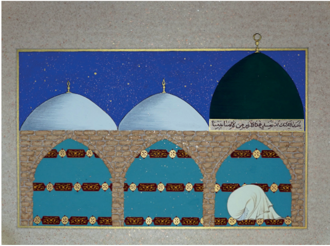
صلاة نسرين La prière de Nesrine (3) Peinture sur papier, feuilles d'or, 53 x 34 cm, 2023 © Aurélia Zahedi, ADAGP, Paris, 2023