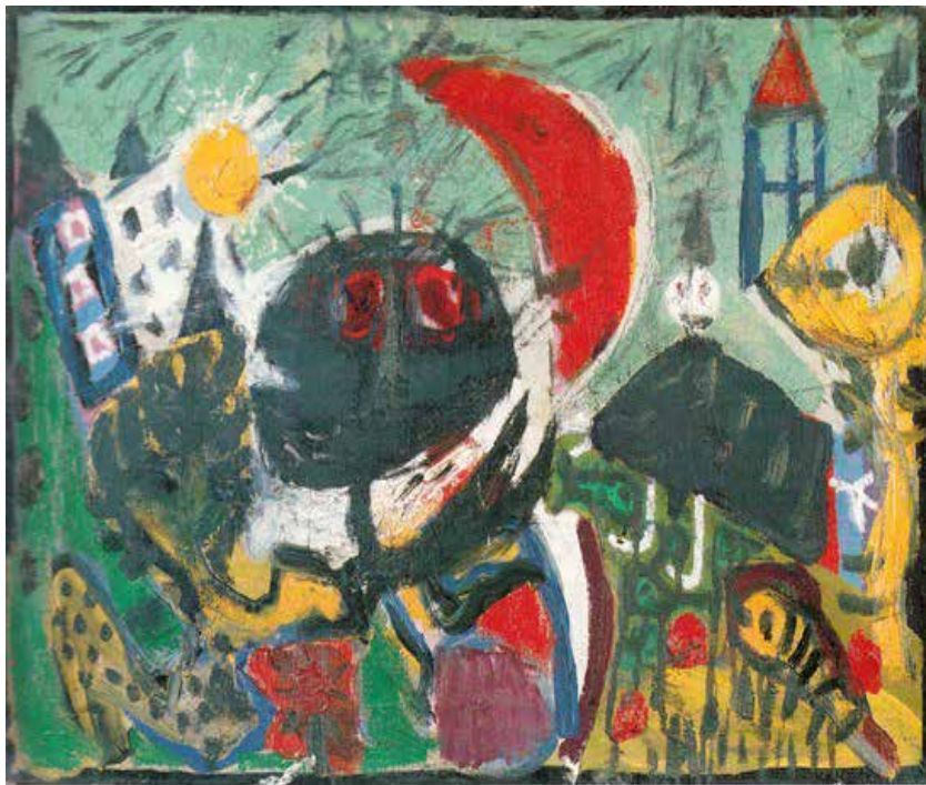
Jorn, Constant, Appel, Corneille, Nyholm Modification Cobra (sur une oeuvre de Mortensen) - 1949 Huile sur toile - 42,5 x 62,2 cm