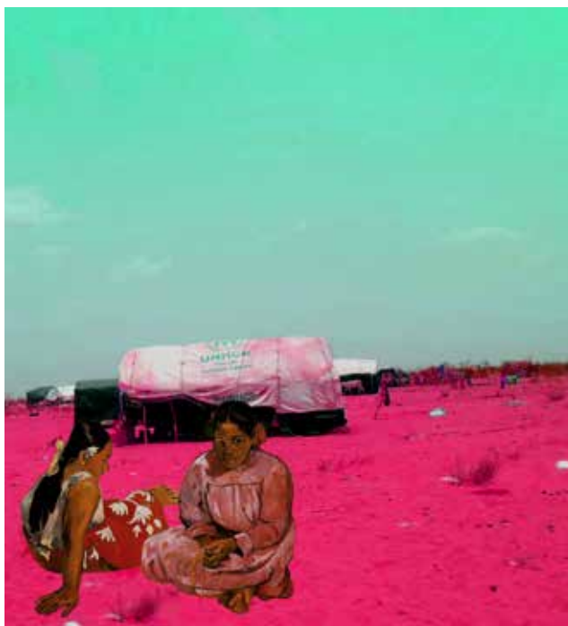
Tammam Azzam , Série Musée Syrien. Sur la Plage (Les Tahitiennes de Paul Gauguin) - 2014. Impression sur papier coton