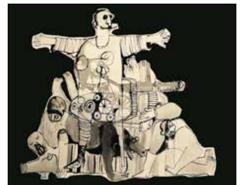
Mohamad Omran De Al-Beida à Ras Al-Ein 2013

Un déjà-vu s'empare de la réalité et l'artiste le traduit par une reprise des motifs et des formes d'expression les plus sombres de l'histoire de la peinture.