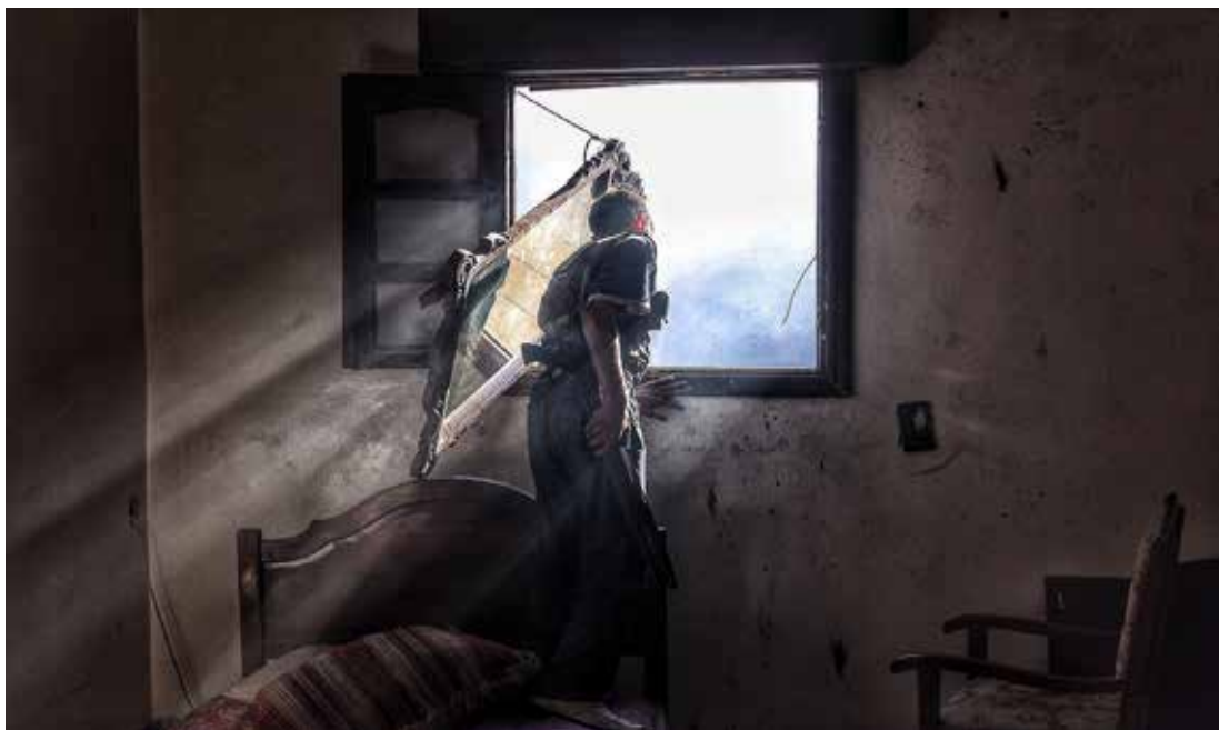
Muzaffar Salman , La lumière pénètre par la fenêtre, tout comme les balles Alep, 19 septembre 2013 - Photographie