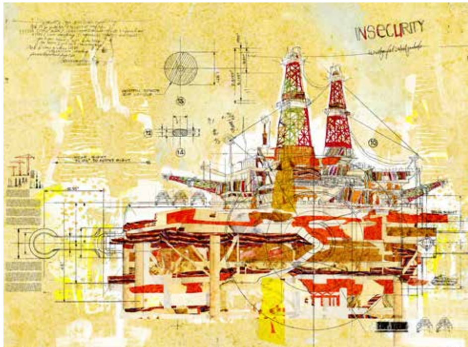
Wassem Almarzouki , Série La Firme - 2013 Techniques mixtes sur papier imprimé