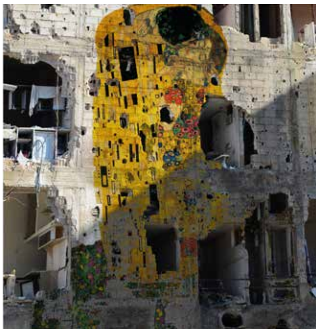
Tammam Azzam , Série Musée Syrien. Graffiti de la liberté (Le Baiser de Gustav Klimt) - 2014. Impression sur papier coton

Depuis l'invention de la photographie, la reproductibilité de l'œuvre d'art et donc le rapport à l'unicité et à la notion d'original, n'ont pas cessé d'être remis en cause. A ce sujet il faut revoir l'essai de Walter Benjamin L'Œuvre d'art à l'époque de sa reproductibilité technique . Ecrivain, historien de l'art et philosophe de l'école de Francfort, Benjamin a réfléchi au concept d'aura de l'œuvre d'art au moment où la copie massive des originaux est devenue possible. L'impact de cette reproductibilité sur la notion de sacré, qui était jusque là inhérente à l'unicité de l'œuvre d'art, bouleverse le rapport des masses aux biens culturels. Avec l'art numérique et la popularisation d'internet, nous assistons encore à une révolution majeure dans l'histoire de la créativité humaine. Le numérique et internet ont changé pour toujours les modalités de création, de diffusion et de partage. La multiplicité des supports et la vitesse ont contribué à démocratiser le processus d'appropriation des œuvres.