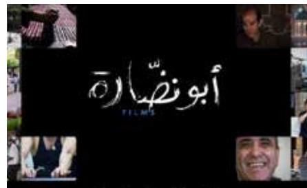
Abounaddara Page d'accueil du site internet du collectif

Plus de 50 de ces films ont déjà été sélectionnés par des grands festivals internationaux de cinéma (Mostra de Venise, The Sundance Festival, Festival du Nouveau Cinéma, Doclisboa, Human Rights Watch film festival, etc.). Ils ont par ailleurs donné lieu à un long métrage diffusé par Arte sous le titre de « Syrie : instantanés d'une histoire en cours ».