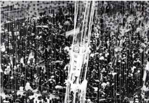
Amer Fahed , L'Horloge du massacre - 2013 Photographie et travail numérique